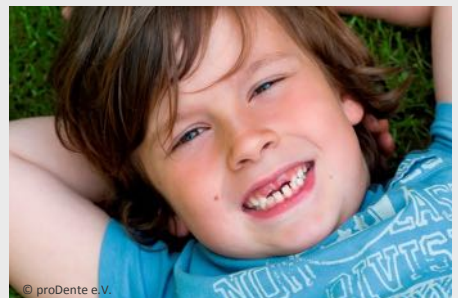
Bei der Prophylaxe lernen Ihre Kinder die richtige Zahnpflege

Es gibt also keinen Grund, warum Sie auf Prophylaxe für Ihre Kinder verzichten sollten.