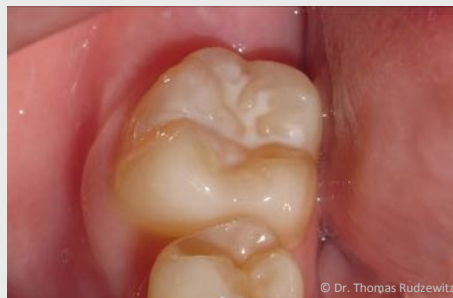
Schutz vor Karies: Versiegelung der feinen Grübchen auf der Kaufläche

Bei der Versiegelung werden die Fissuren mit einem hellen Kunststoff dauerhaft verschlossen, so dass an diesen Stellen keine Karies mehr entstehen kann (siehe Abb. unten).